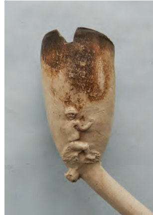
Afb. 41. Ovaal model, driemaal zijmerk Job op de mesthoop, Alphen?, 1750-1800.