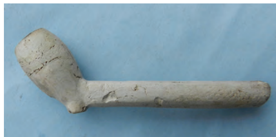
Afb. 5. Eerste generatie pijp, West of Noord Nederland, 1590-1610, H.27mm.