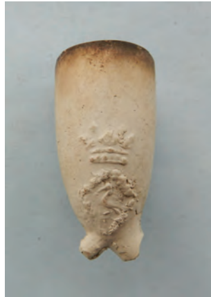
Afb. 40. Ovaal model, zijmerk gekroonde ooievaar in ruit van bloemen. Alphen?