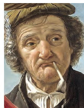
Afb. 25. Man met rondbodem pijp. J.H. de Coene, 1827.