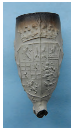
Afb. 36. Ovaal model met generaliteitswapen, hielmerk 9 gekroond.