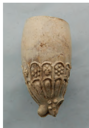
Afb. 47. Ovaal model, schelppijp, ketelmerk IVE. Gorinchem, Jan van Erp, [1778]-1817.