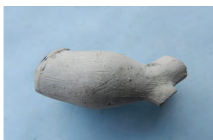
Afb. 11. Ketel met groeven, ongemerkt, 1645-1660.