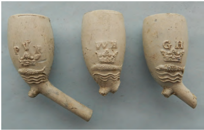
Afb. 37. Ovale modellen, gekroonde vis met zijmerken PVR, WH en GH. Alphen, 1760-1800.