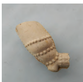
Afb. 10. Dubbelconisch, ongemerkt, Leiden, 1660-1680,