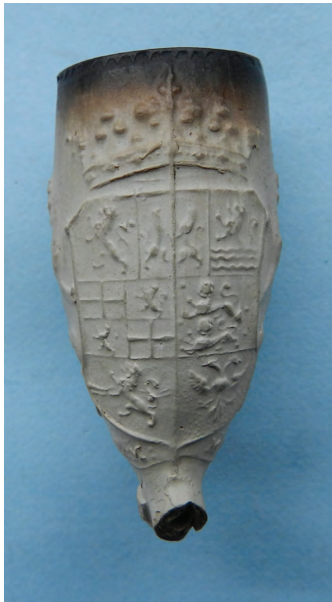
Uitvergroting van afb. 36: Ovaal model met generaliteitswapen, hielmerk 9 gekroond.