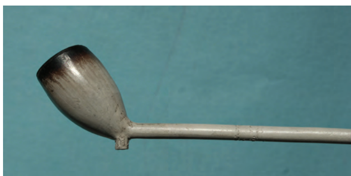
Afb. 23. Kort ovaal model, steeltekst K.VERBY. IN: GOUDA, hielmerk 9 gekroond. Gouda/Alphen[?].

Deze pijpen lijken originele Goudse producten te zijn. Een duidelijk imitatie uit Alphen heeft de tekst K.VERB / GOUDA in plaats van VERBY. Op het Goudse wapenschild van deze pijp zijn drie extra stippen op de middenbalk geplaatst. In de rechter balk van het wapen staan twee sterren en op de plaats van de derde ster is een kruisje onder een cirkel geplaatst; een gestileerd wapen van Aarlanderveen. Door deze kleine details, die vaak alleen met een sterk vergrotende loep zijn waar te nemen is het vaak moeilijk de originelen van de imitaties te onderscheiden. Een aantal Alphense pijpenmakers hebben, al dan niet opzettelijk, het Goudse wapen in de persvormen vervalst of verwijderd en namen die direct in gebruik waardoor op het oog