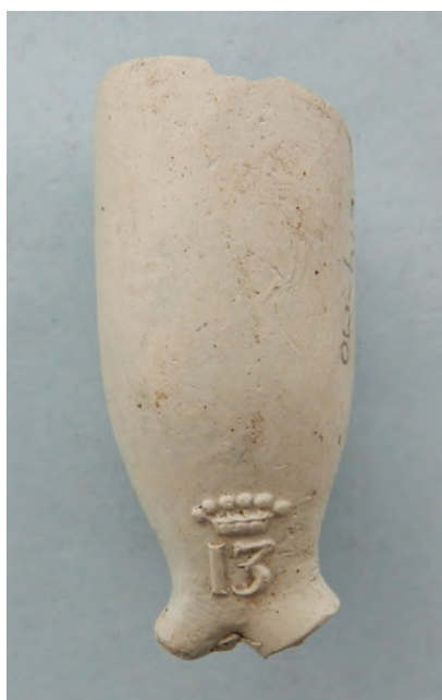
Afb. 20. Trechter, zijmerk 13 gekroond met FP, 1720-1735.