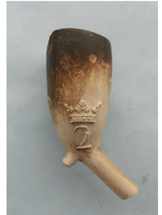
Afb. 42. Ovaal model, zijmerk 2 gekroond, Alphen?, 1750-1800.