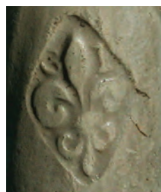
Afb. 8. Steelfragment met lelie met Gl. Gouda, 1635-1650.