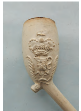
Afb. 45. Ovaal model, zijmerk lampetkan met AN gekroond. Gouda, Antoni Nobel, 1771-75.