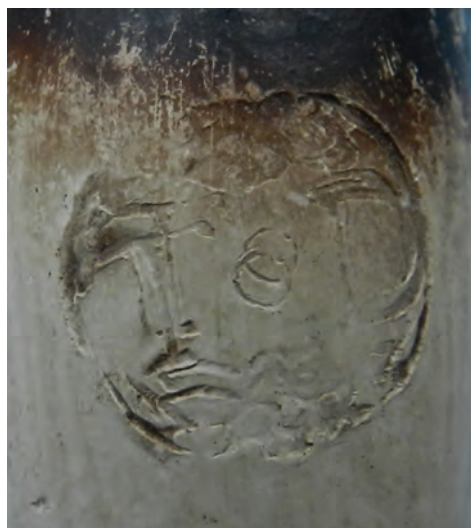
Afb. 35. Kromkop, ketelmerk TD in ovaal. Alphen[?], 1770-1800.