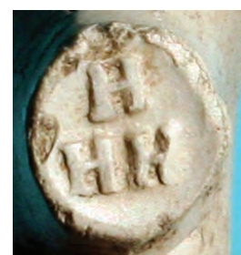
Afb. 13. Trechter model, hielmerk HHH. Alphen of Gouda[?], 1715-1730.