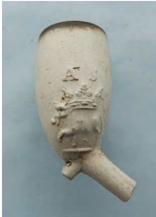
Afb. 39. Ovaal model, zijmerk AS met gekroonde os. Alphen?