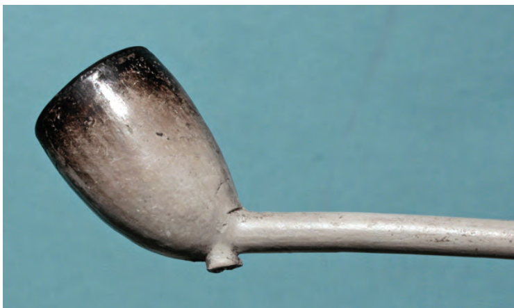
Afb. 33. Ovaal buitenmodel, hielmerk 25 gekroond. Alphen, 1760-1810.