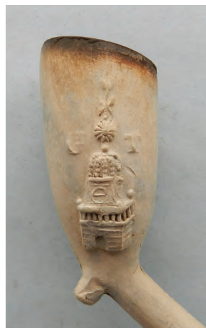
Afb. 21. Trechter, zijmerk Goudse toren met GT. Gouda, 1710-1735.