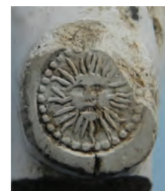
Afb. 9. Hielmerk zon. Gouda, 1660-1680.