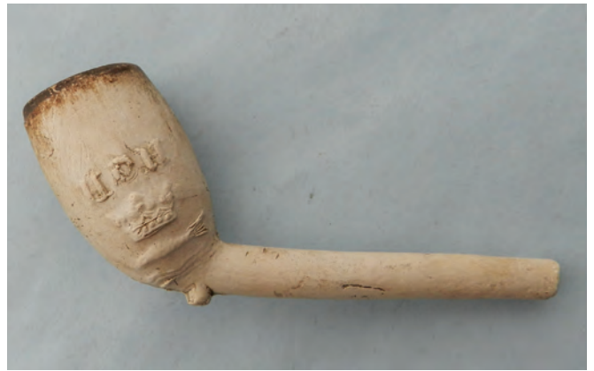
Afb. 38. Ovaal model, zijmerk HOH met vis gekroond, Alphen.