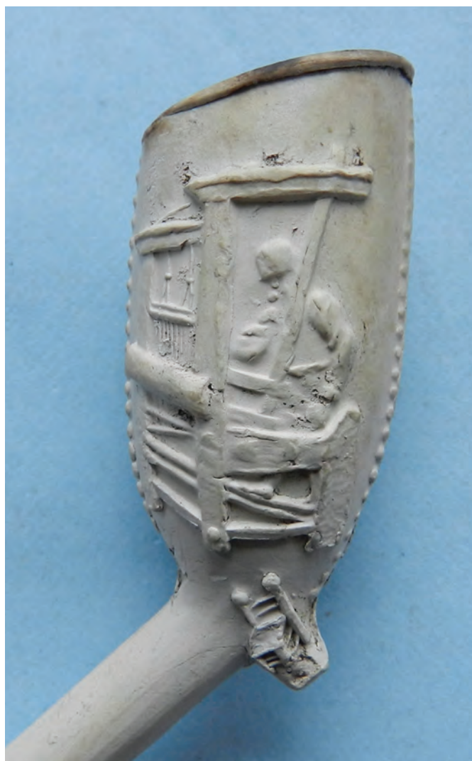
Afb. 22. Trechter, vioolspeler en wever. Gouda, 1710-1730.