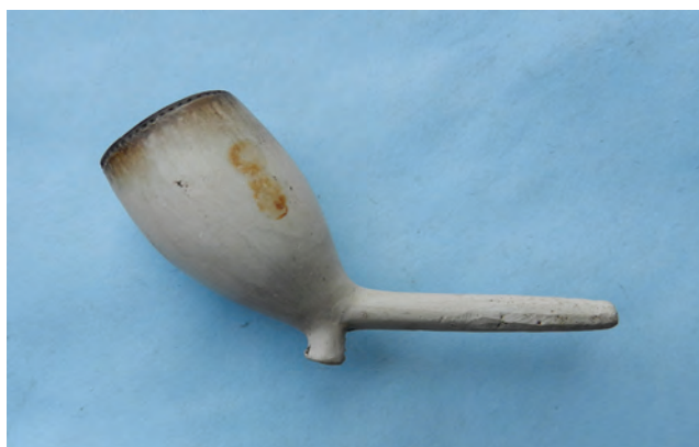
Afb. 3. Kort ovaal model met bijgewerkte steel, hielmerk 9 gekroond. Alphen, 1740-1760.

De pijpen zijn over het algemeen zwaar gerookt en hebben een zwarte roetaanslag zowel in de tabaksketel als aan de buitenzijde. (Afb. 4) De hieronder gegeven mate waarin de pijp gerookt is, is altijd een benadering. Pijpen die geen rooksporen vertonen kunnen voor gebruik zijn gebroken of zijn schoongebrand in het vuur van een afvalhoop waarin ze werden weggegooid. Van de vijf dubbelconische fijne pijpen uit de periode 1620-1680 zijn er vier zwaar gerookt en één licht. Bij de dubbelconische grove pijpen is 58% (22 ex.) zwaar gerookt, 18% (7 ex.) middel gerookt, 13% licht gerookt en 8% heeft geen rooksporen. Van de fijne gemerkte trechtermodellen is 49% zwaar gerookt, 17% middel gerookt, 17% licht gerookt en 17% zonder rooksporen. Bij de grove trechters zien we ongeveer dezelfde percentages, namelijk 56% zwaar gerookt, 17% middel gerookt, 16% licht gerookt, 7% zonder rooksporen en 4% onbekend. Er is daarbij geen verschil tussen de fijne gemerkte pijpen en de ongemerkte en gemerkte pijpen van de grove kwaliteit. Het zwaarst gerookt zijn de ovale modellen waar onder de lange pijpen en de korte pijpen die tijdens het