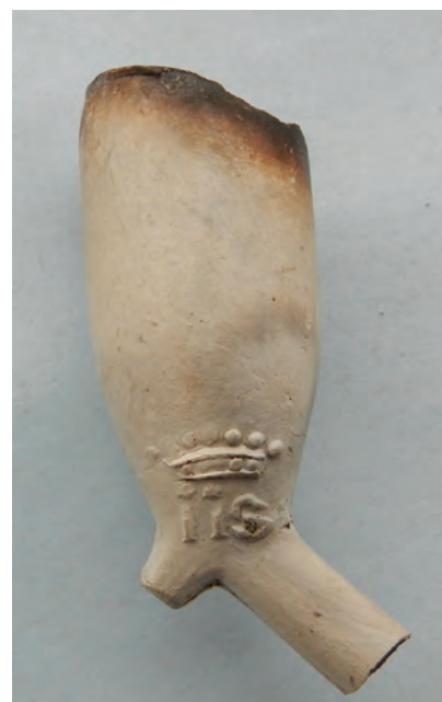
Afb. 19. Trechter, zijmerk iiS gekroond. Gouda/Alphen[?], 1715-1735.