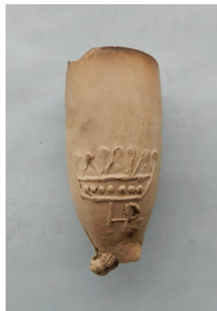
Afb. 43. Ovaal model, zijmerk HPK monogram gekroond. Alphen?, 1740-1770.