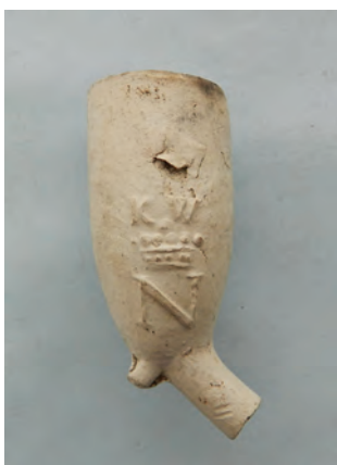
Afb. 46. Ovaal model, zijmerk KW met N gekroond. Gorinchem?, 1750-1775?