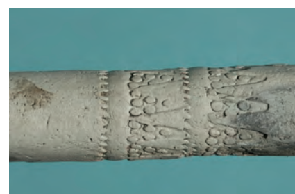
Afb. 12. Steelfragment met chevrons, stippen en raderingen, 1650-1700.