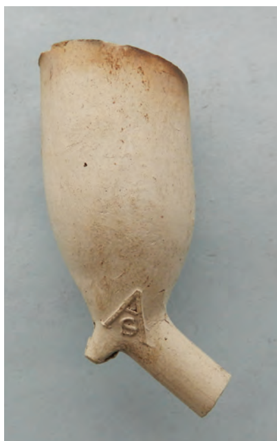
Afb. 18. Trechter, zijmerk AS monogram. Gouda, 1730-1740.